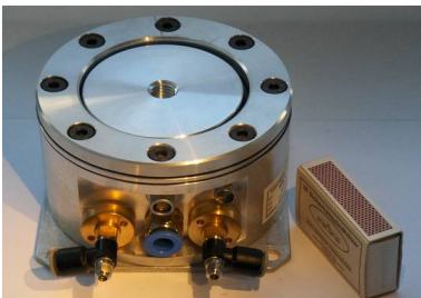
Baugruppe montiert: pneumatischer Dämpfer