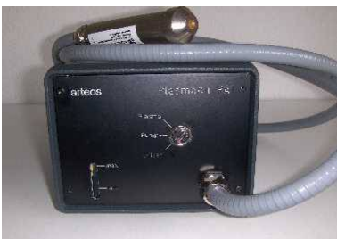
Gerät montiert: Plasma-Reinigungs-Gerät