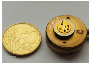
Gehäuse WIG-geschweißt & Glaslötung