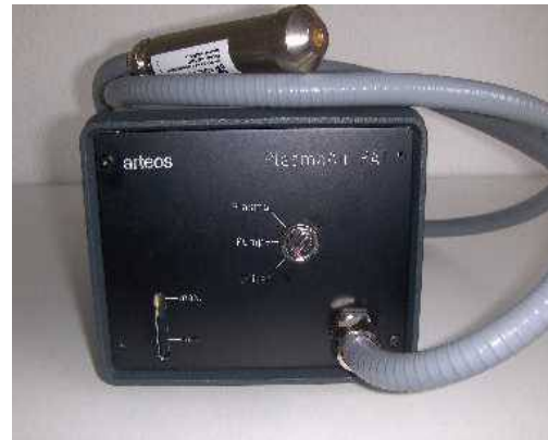
Abb. 3: Atmosphären-Plasma-Gerät