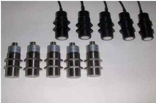
Abb. 1: Ultraschall-Sensoren