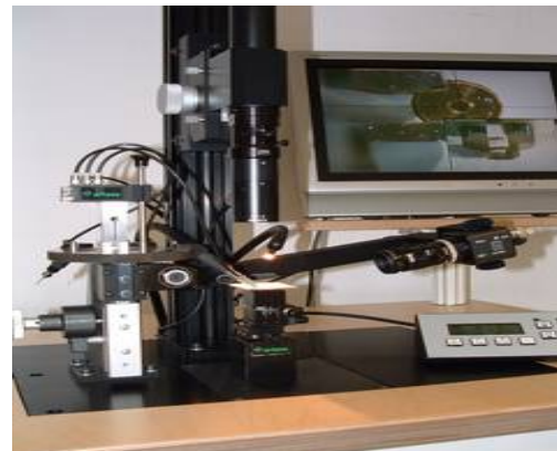
Abb. 6: hybride Mikromontage-Station