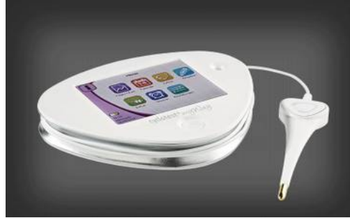
Abb. 2: Schwangerschaftstest-Gerät